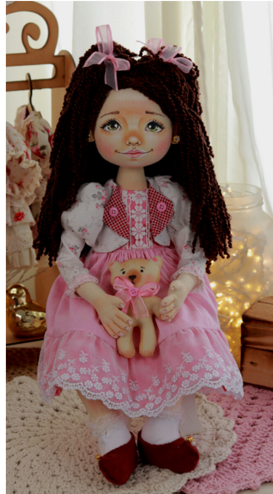
Essa é a Boneca Pitaya da Escola Bonequeira Vip